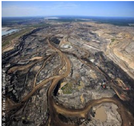
Ölsandabbau in Kanada

Lebensräume von Tieren und Pflanzen wurden und werden zerstört. Das Abbaugebiet erstreckt sich auf etwa 149.000 Quadratkilometer – größer als die Fläche Englands 1 . Waldflächen, Erde und Torf werden hier abgebaggert, riesige Tagebau-Krater wachsen. Bald soll auch der nördliche Nadelwaldgürtel Kanadas dem Tagebau weichen. Etwa 8,73 Milliarden Tonnen CO 2 sind in den Nadelwäldern gespeichert, die für den Abbau von Ölsanden vorgesehen sind.